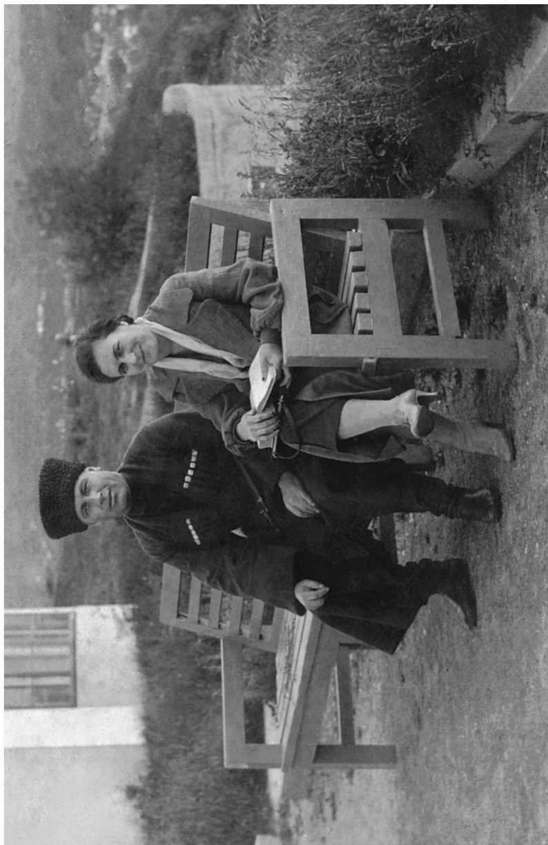
Барон Йәе бинойнаг Олыгәимәе Кисловодскы. 1940 аз.