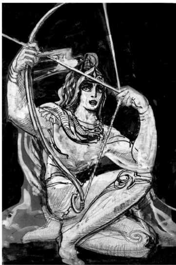
Сослан æмæ зæрватыкк.