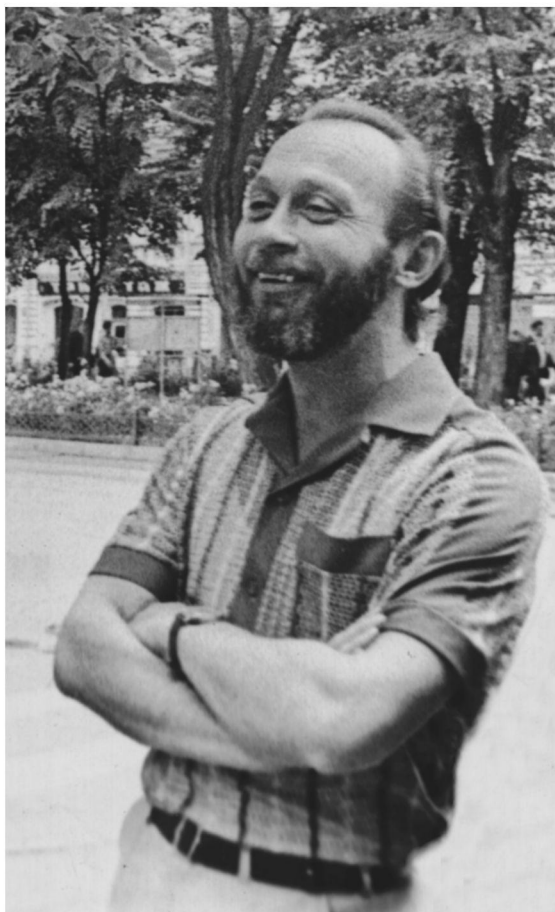
Ныккасти хур Ирыстонмæ фæсуард...