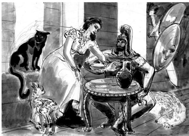
Сатана æмæ Батрадз.