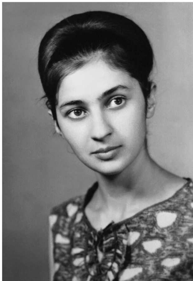
Мæ зæрдæйы æртæтигъон цъæх цъитийы Ды ссудзын кодтай пиллон арт.