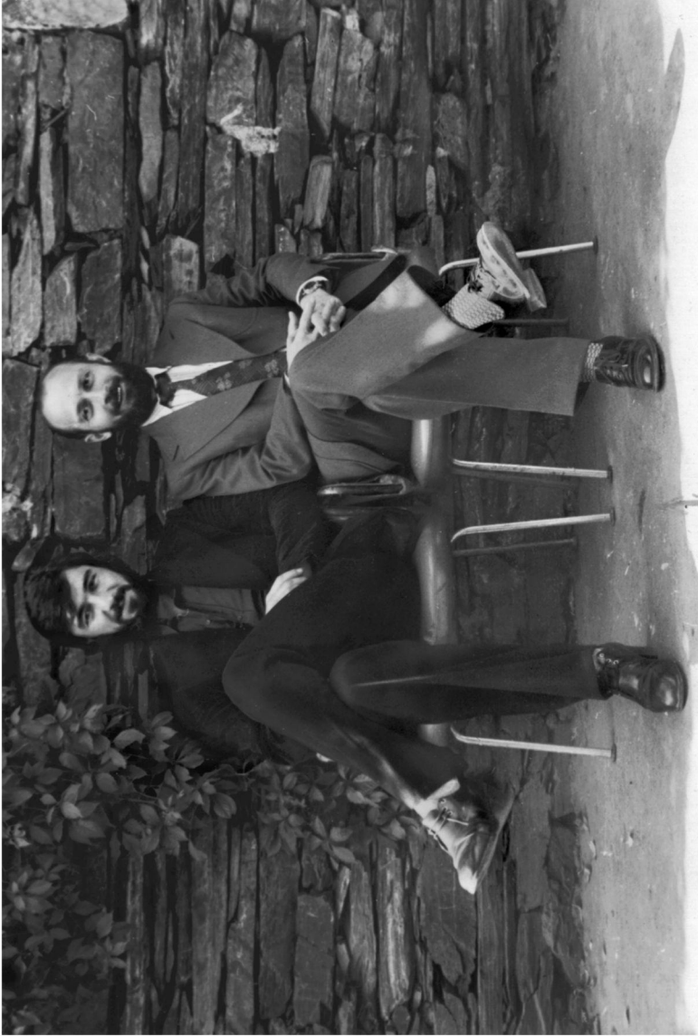
Амбал кэмсэн нэгий, уйцы стыр Хуыцау, Амбал кэмсэн нэгий, ахэам лээг мээ ма скээн!