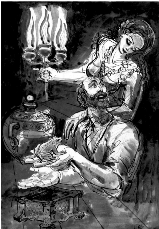
Хæмыц æмæ Быценон.