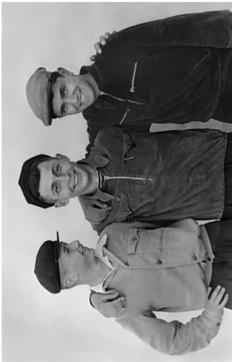
Угэ цэвхээр мэгэ Дардгэй фээгтавы Ныр дээр.