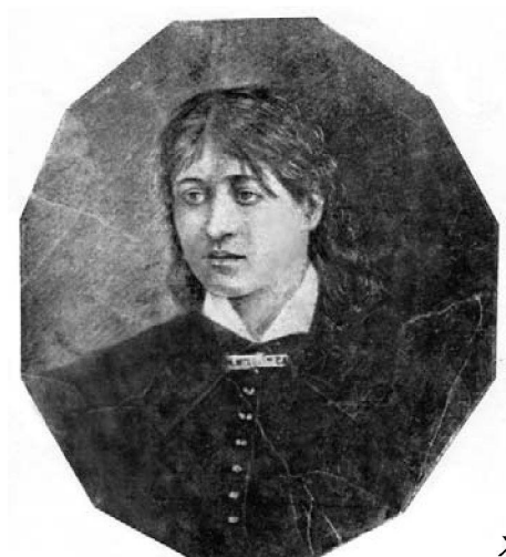
Жукаты Косерханы сурæт.