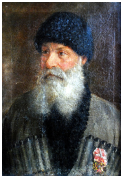
Гуытæиаты Мысырбийы сурæт.