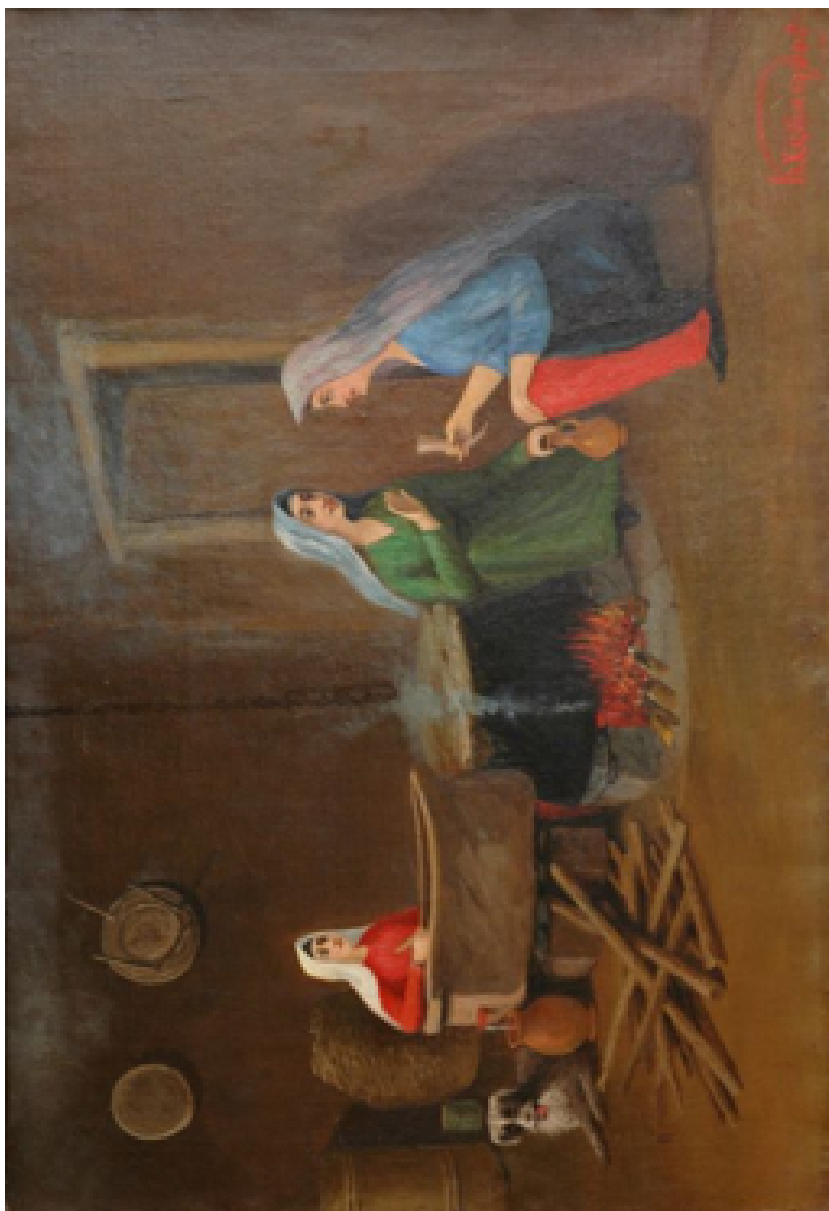
Ирон хohaг хаедзары