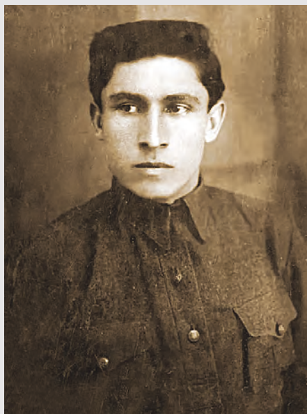
Нафи 16-аздыдæй барвæндонæй ацыд Фыдыбæстæйы Стыр хæстмæ