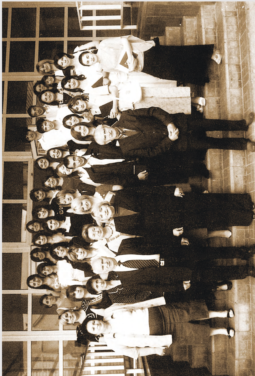
ЦИПУ-йы ирон филологийы факультеты студентга ама ахуырганджытыма