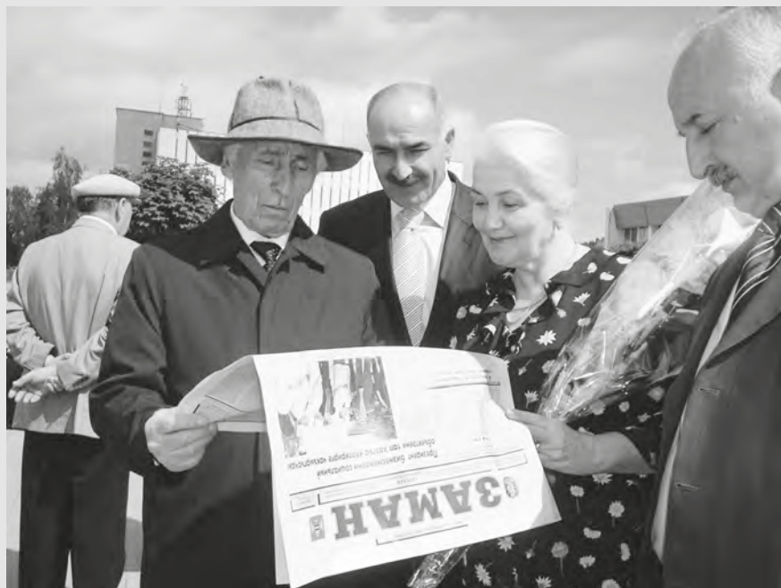
Налцыччы йæ хæлæрттимæ