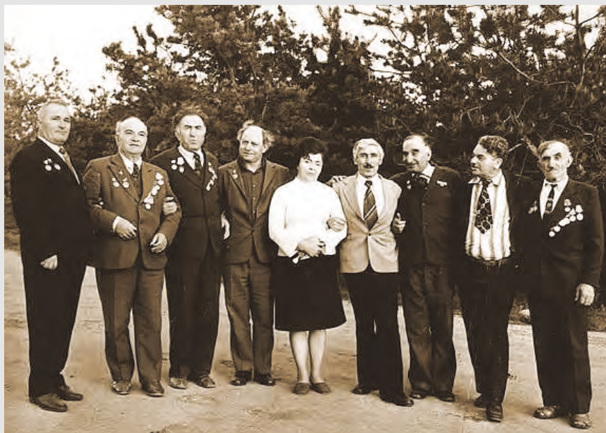
Йæ хæстон æмбæлттимæ