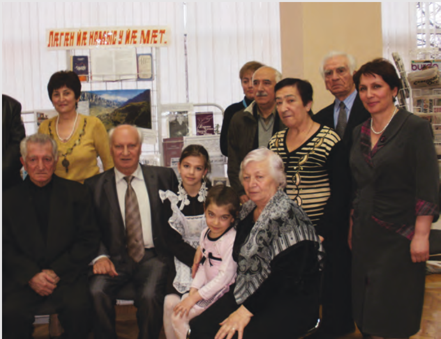
Йаъ 65 азы юбилейы фæдыл мадзал Дзауджыхъæуы Сæйраг чиныгдони