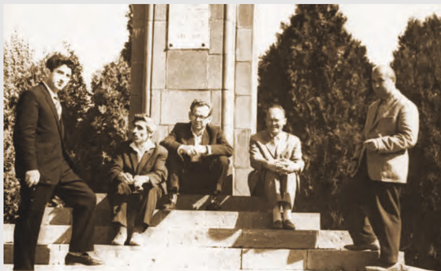
Къостайы цыргы раз йе 'мкусджытимæ