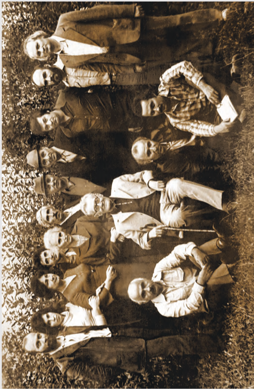
Абайты Васоимæ фембæлд Реданты