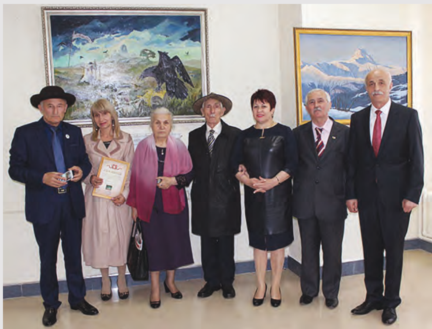
Нафи йә номыл премийы лауреаттә әмә бындурәвәрджытимә. 2016 аз