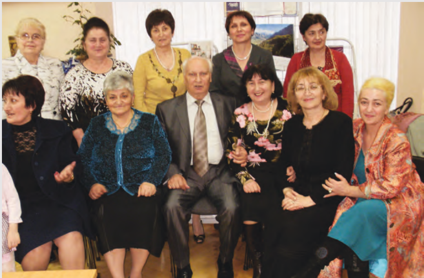
1976 азы рауагъдонтимæ