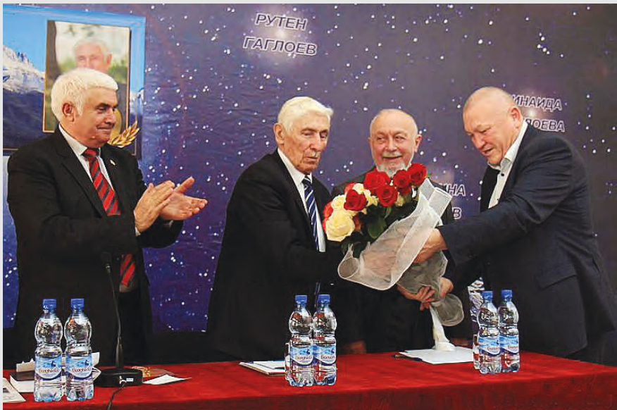
Йæ 90 азы юбилейы Хуссар Ирыстоны