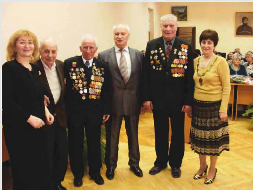
Йә 65 азы юбилейы фәдыл мадзал Дзәуджыхъәуы Сәйраг чиныгдоны