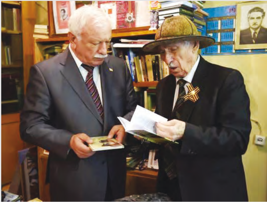
Донецкаг журналистимæ фембæлд