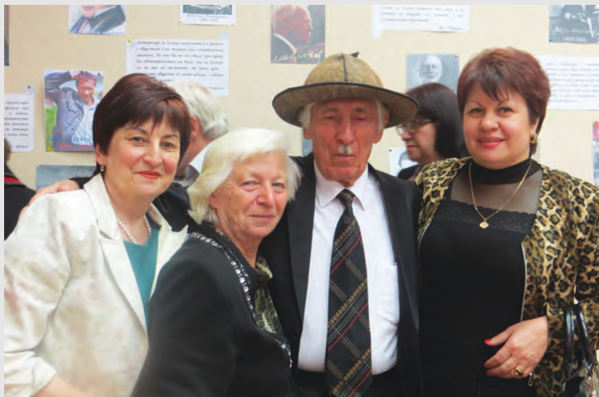
Йә 90 азы юбилейы