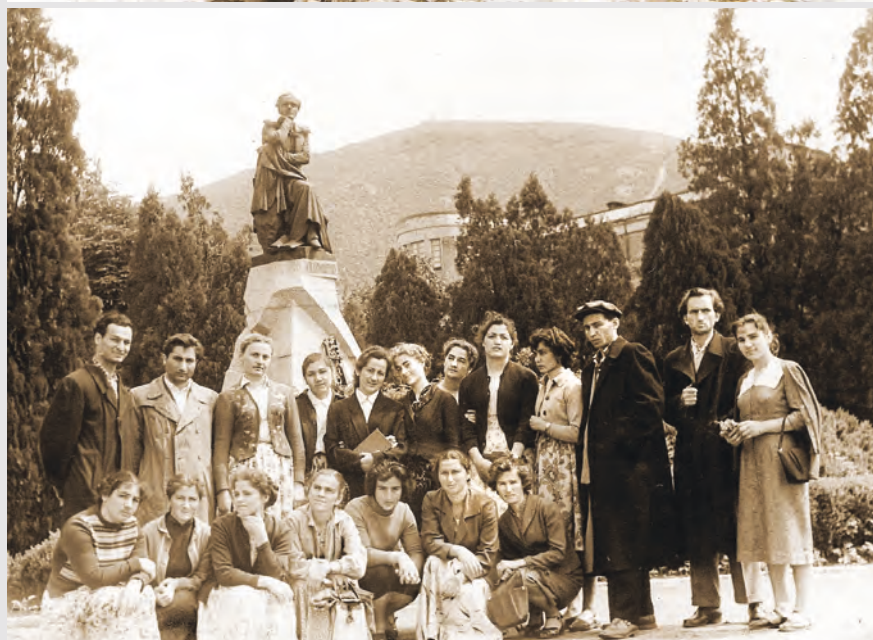
Йе 'мкурсонтимæ Пятигорскы