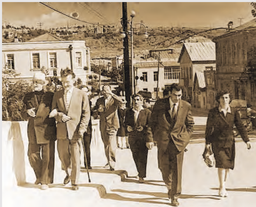
Заронд хидыл Цхинвалы