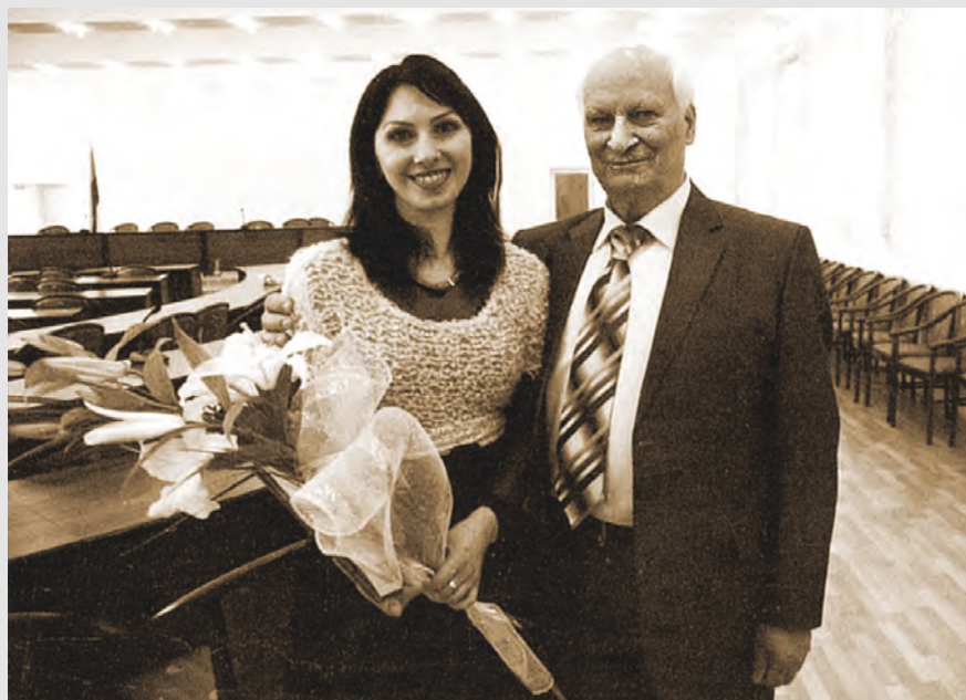
Йæ чызг Зæринæимæ