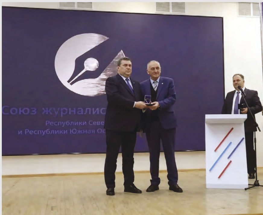
Уæрæсейы Журналисты цæдисы Кады нысан исгæйæ