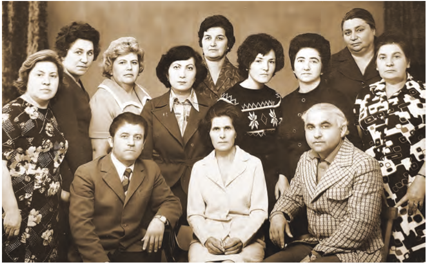
Рауагъдад «Ир»-ы кусджытимæ