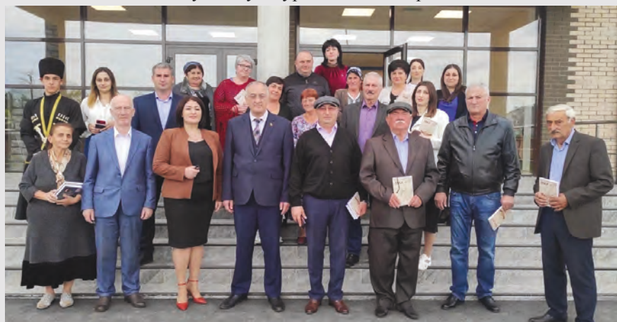
Ставд-Дурты Бицъоты Гриси мысæн изæры