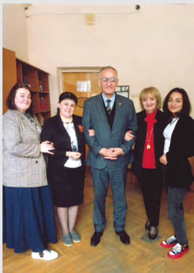
Журналистикæйы факультеты ахуыргæнджытимæ