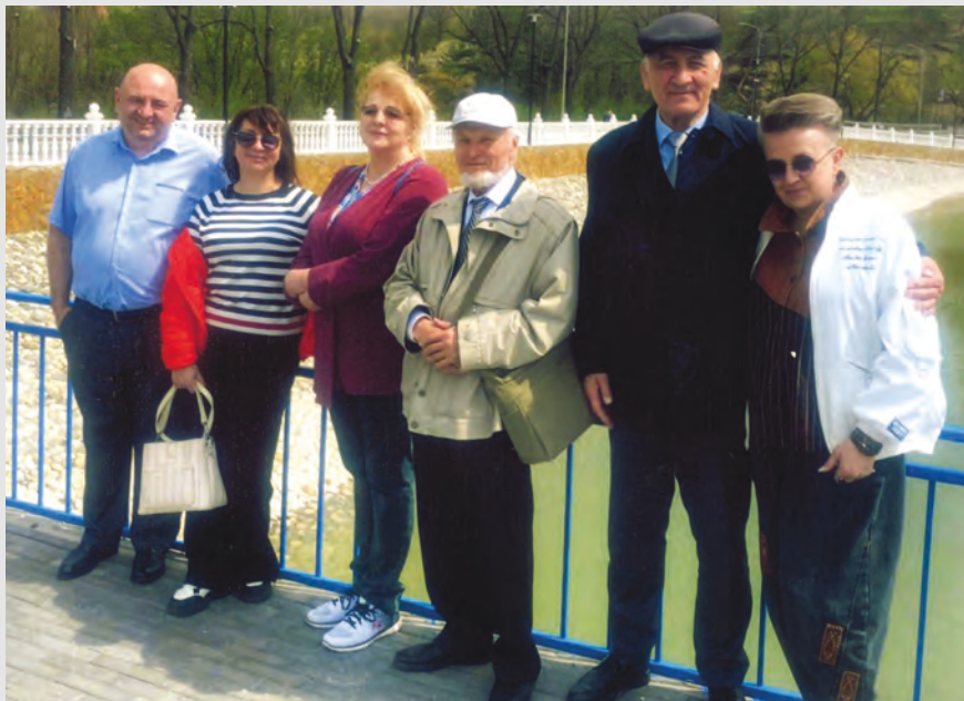
Фестиваль «Белые журавли»-йы архайджытимæ. Дагестан. 2023 аз