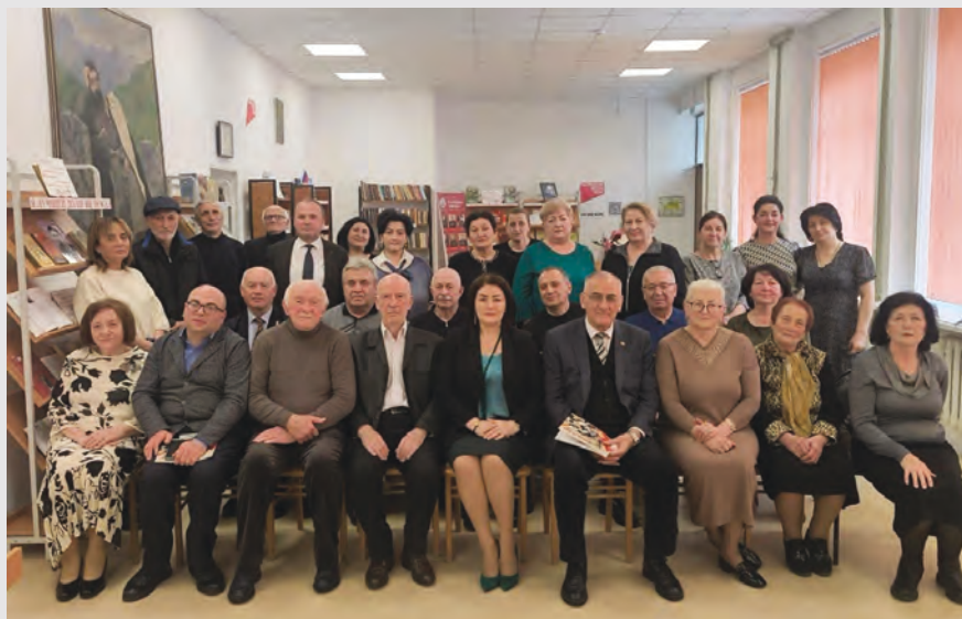
Сечъынаты Ладемыры мысаен изәр Алагыры