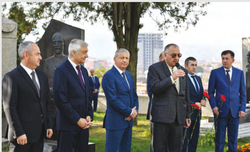
Хетæгкаты Къостайы райгуырды 159 азы бон. Ирон аргъуаны кæрты