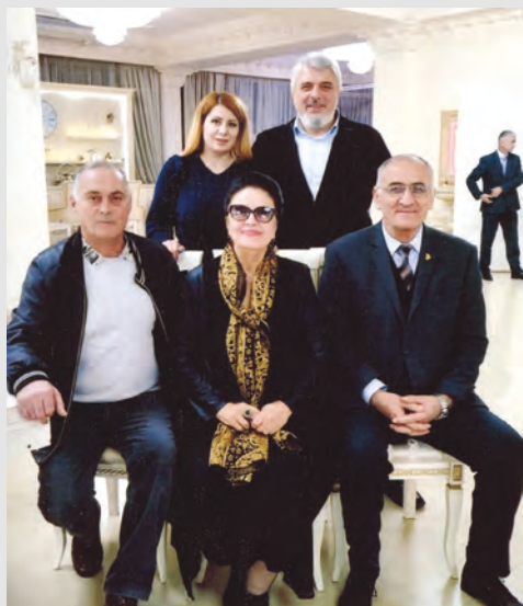
Фестиваль «Ирон фæндыр»-ы архайджытимæ