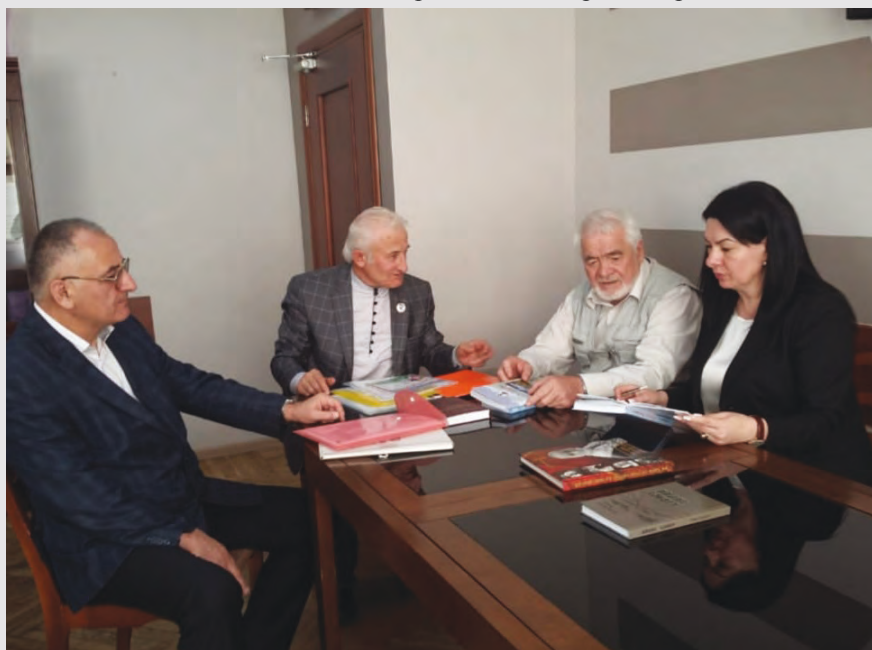
Нафийы номыл премийы къамисы уәнгтә