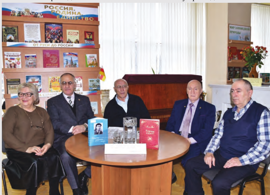
Хозиты Яковы мысæн изæры