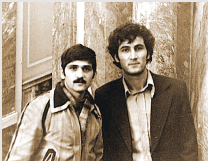
Таказты Валериимæ Бегъырбухы. Студенты азгæ