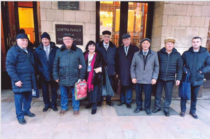
Уæрæсейы фысджыты XVIII съезды делегаттимаæ. 2025 аз