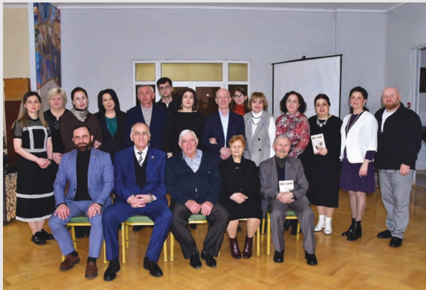
Журнал «Мах дуг»-ы сармагонд номыры презентацийы