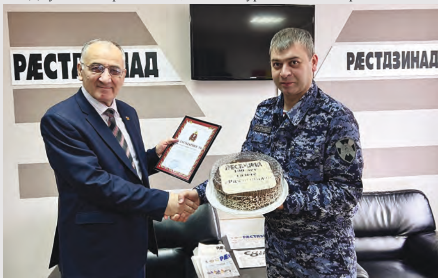
Уæрæсейы гвардионтæ арфæ кæнынц газет «Рæстдзинад»-ы коллективæн йæ 100 азы юбилейы фæдыл