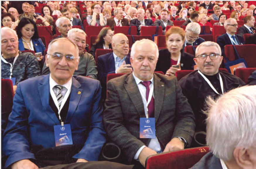
Уæрæсейы фысджыты XVIII съезды. 2025 аз