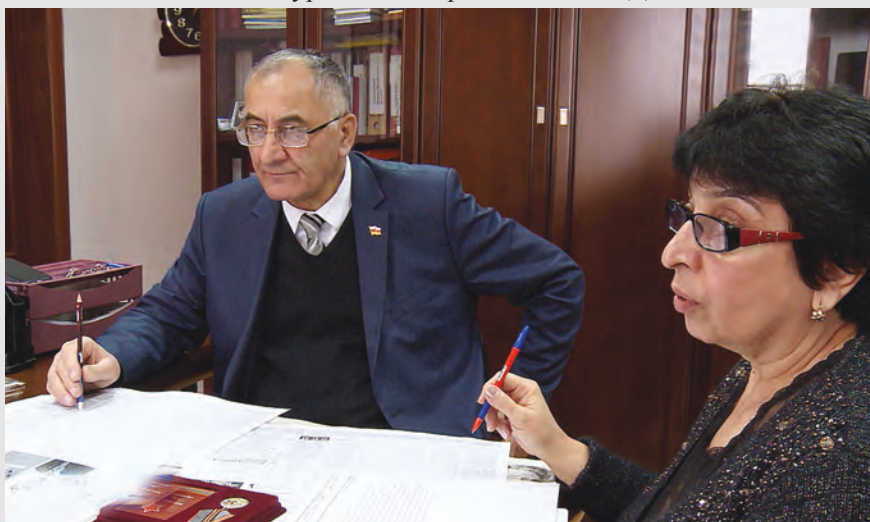
Куысты рæстæг газет «Рæстдзинад»-ы