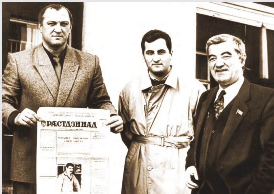
Андиаты Сослан æмæ Мæхæмæтты Ахуырбегимæ