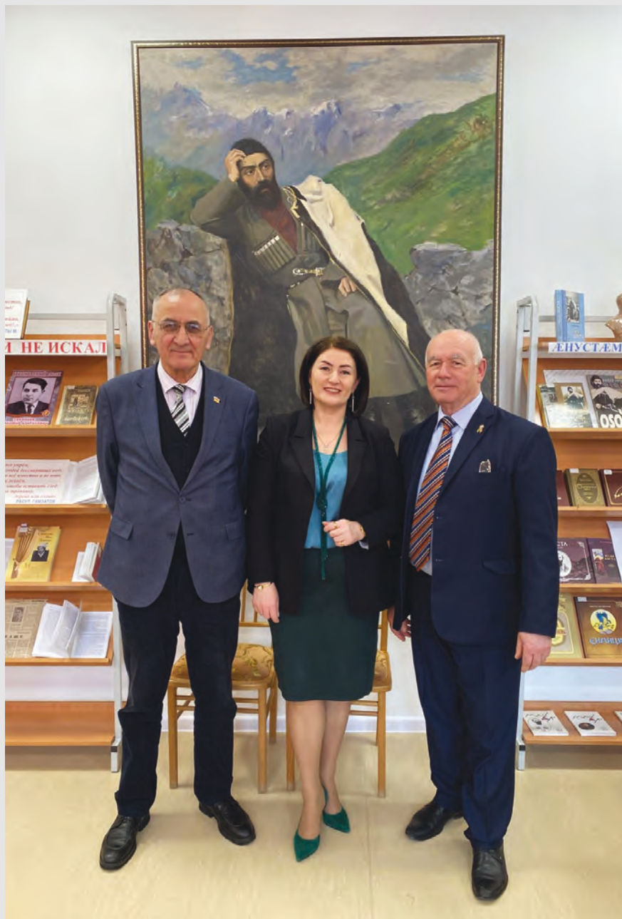
Сечъынаты Ладемыры мьсаён изаер Алагыры