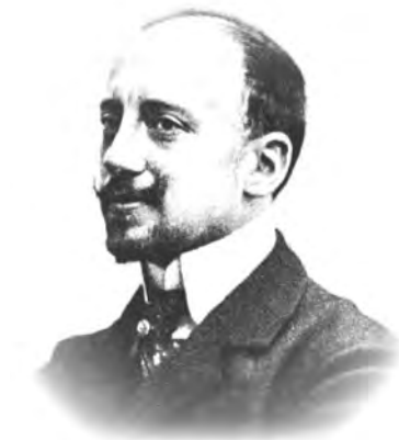
Габриэле Д ‘Аннунцио

æнкъарæнтæ (радзырд «Идæдз ус»), аннæрдыгæй – лæгау лæджы удысконд, ноджы ма уыцы иу рæстæг фыдракæндмæ дæр цæттæдзинад.