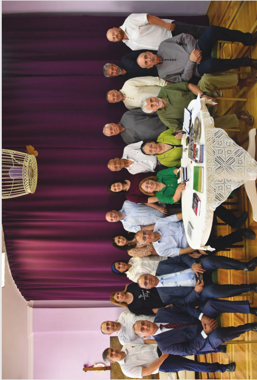
Кавказы фысджыгы Клубы уангтиме