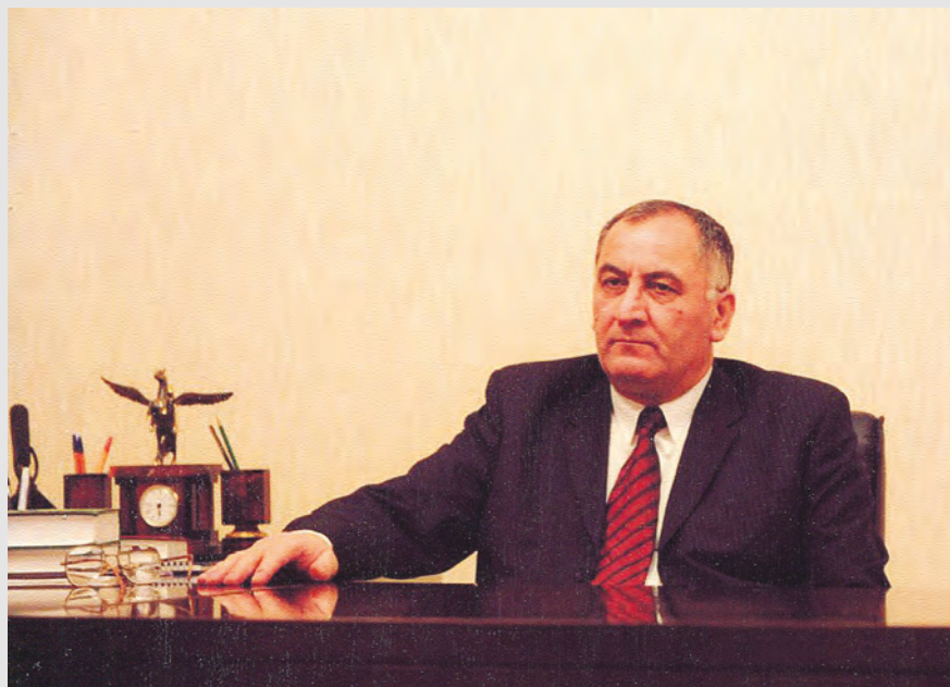
Йæ кусæн уаты